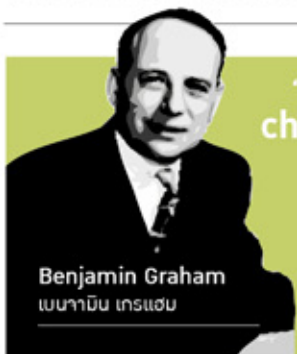
Benjamin Graham เบนามิน เกรแฮม

ประเทศไทยเริ่มมี พ.ร.บ. ประกันภัยครั้งแรกในปี 2510 ซึ่งในระยะเริ่มต้น มียอดเงินประกันเพียง 1 พันล้านบาท และค่อยๆ สะสมและขยายจนถึงปัจจุบัน มียอดประกันรวม 2.05 แสนล้านบาท ตามกิจกรรมทางเศรษฐกิจ ซึ่งคาดว่าจะการเปิดเสรีการค้าการลงทุนตามข้อตกลงประชาคมเศรษฐกิจอาเซียน จะก่อให้เกิดการเดินทางไปมาหาสู่กัน การแลกเปลี่ยนการลงทุนระหว่างกัน ซึ่งย่อมต้องการความมั่นคงปลอดภัย การประกันภัยย่อมมีโอกาสเติบโตสูงขึ้น B